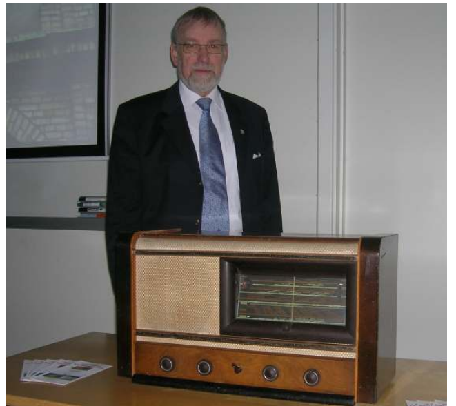
Dines Bogø bag vor Philips 914X, samt RFR-brochurer.

Radioen kostede i 1941: 795 kr. + 50 kr. i Statsafgift