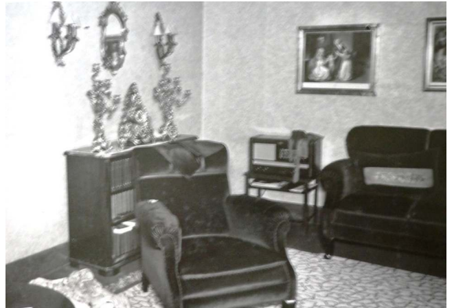
Herreværelset på Peter Bangs Vej